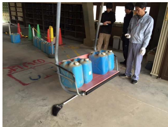
制動試験ウエイト積み込み状況