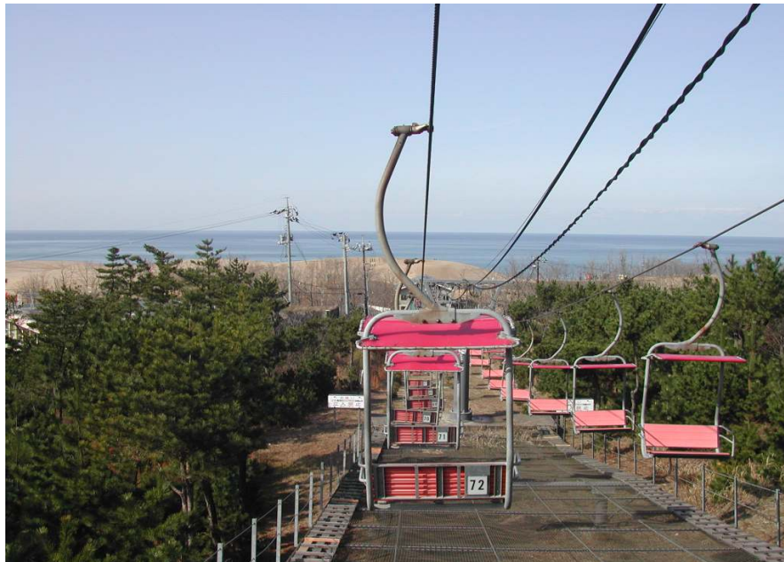
鳥取砂丘観光リフト