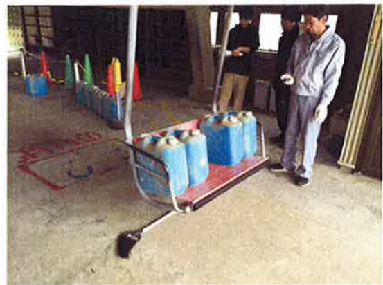
制動試験ウエイト積み込み状況