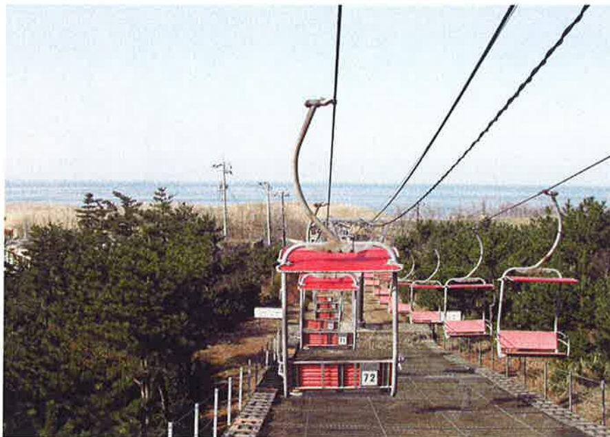
鳥取砂丘観光リフト