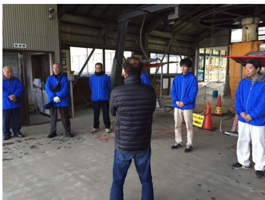
1 2 月検査状況